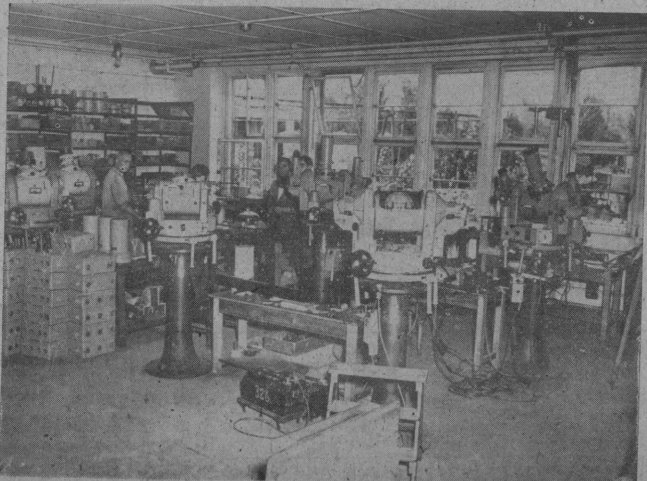
Como es sabido, han sido descubiertos en la zona norteamericana, de Berlín, unos talleres destinados a la fabricación clandestina de material de guerra, por cuenta de Rusia. En la fotografía pueden verse dos motores giroscópicos, medio construidos, para utilizarlos en aviones, submarinos y tanques.