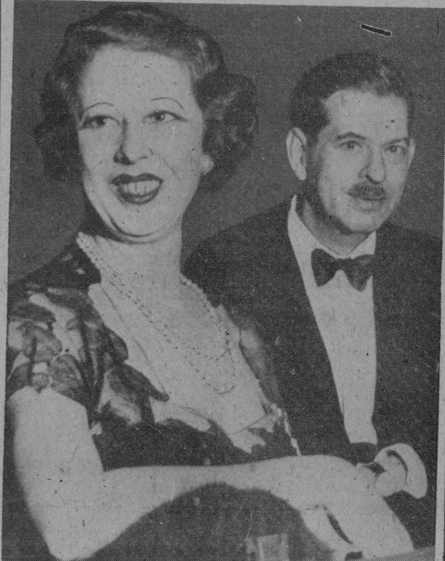
He aquí una de las últimas fotografías del ex Rey Carol de Rumania y madame Lupescu, cuyo matrimonio se celebró en Rio de Janeiro, donde ambos residen, y cuando la segunda se hallaba en el lecho, enferma de gravedad y con peligro de muerte próxima, según el dictamen de los médicos que la asistían. Este pronóstico no se ha cumplido, asegurándose ahora que madame Lupescu vivirá todavía largo tiempo, convertida en esposa legítima del ex Monarca exilado, con el nombre de princesa Elena de Rumania.