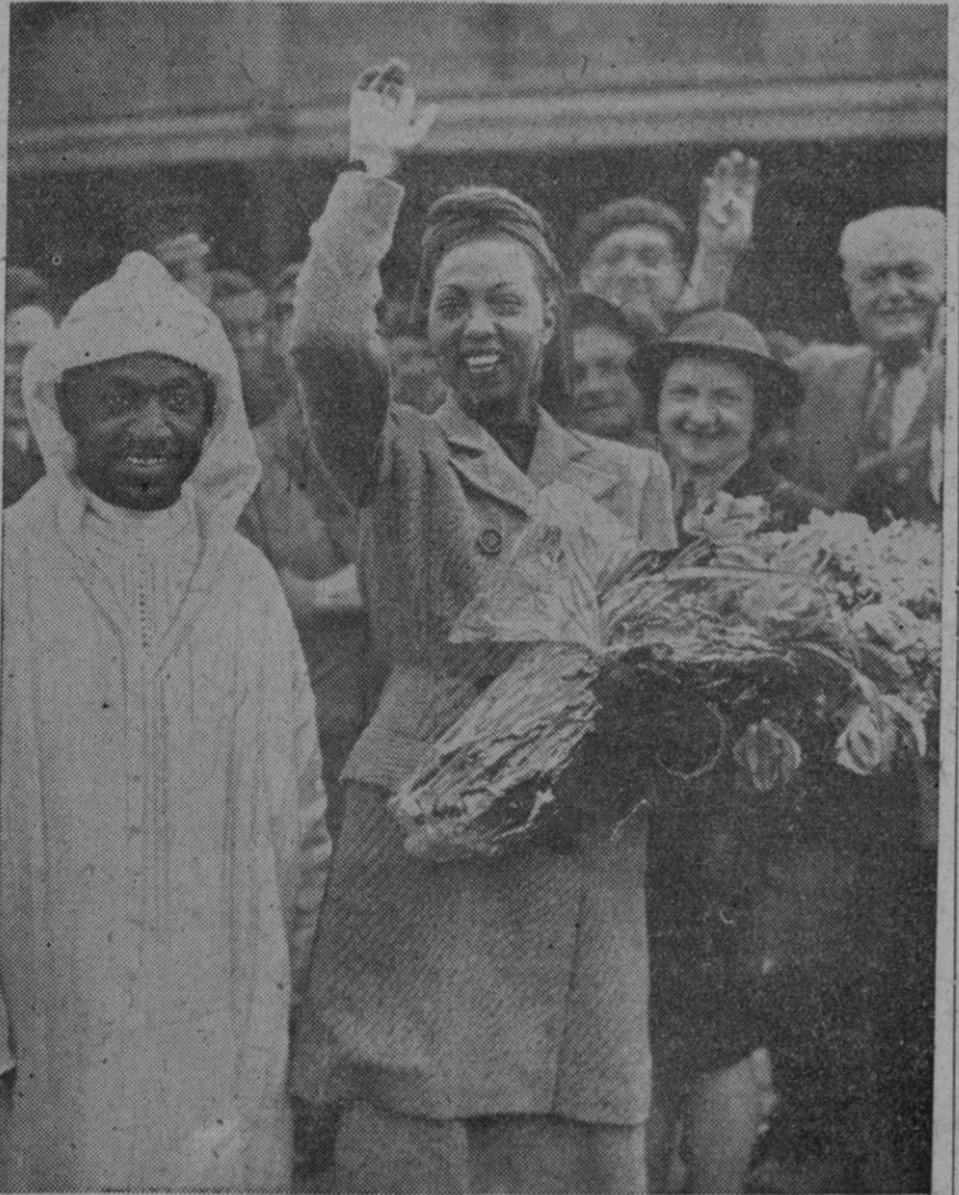
La famosa bailarina negra Joseфина Baker, que durante la guerra fué te-niente de la aviación norteamericana, se encuentra ahora en París, en donde ha sido obtenida esta foto

La Catedral de Solsona será reconstruida