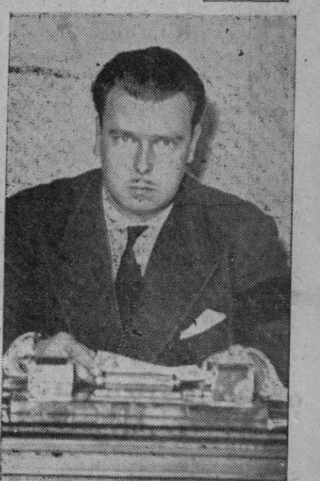
El gran duque Vladimiro, reconocido por los rusos blancos emigrados como pretendiente al Trono de todas las Rusias

Sevilla, 9.—Ha llegado a Sanlúcar de Barrameda el gran duque Vladimiro de Rusia, que reside habitualmente en París. En Sanlúcar es huésped de honor de los infantes don Alfonso de Orleans y de doña Beatriz de Sajonia.—Cifra.