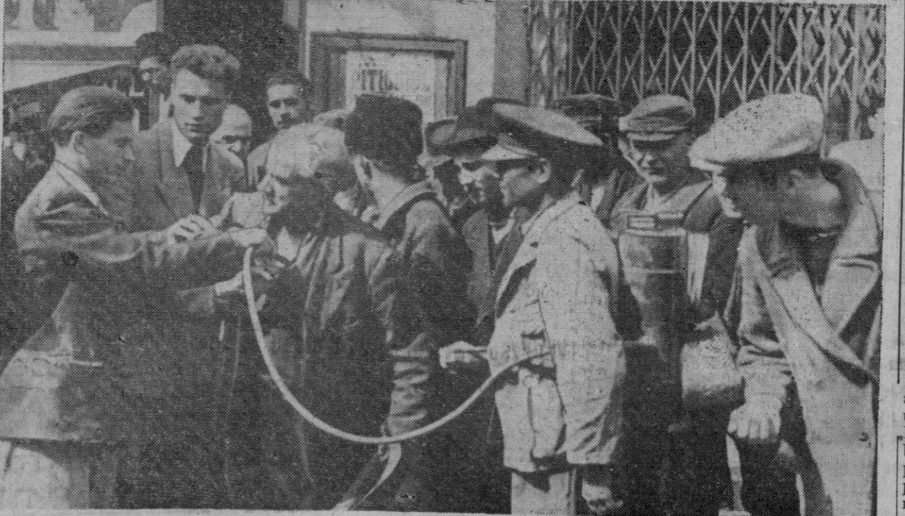
Las autoridades sanitarias rumanas han iniciado una enérgica campaña contra las fiebres tifoideas, temiendo que la epidemia cause estragos en Bucarest de un modo inminente. Los transeúntes de la capital rumana son sometidos, en plena calle, a un tratamiento a base de insecticida D. D. T. Evidentemente el hombre de la foto sometido al tratamiento parece demasiado sorprendido por el procedimiento y no lo acepta de buen grado

Se destinarán a las tropas soviéticas de ocupación Los rusos se llevan el trigo enviado por EE. UU. a Rumania