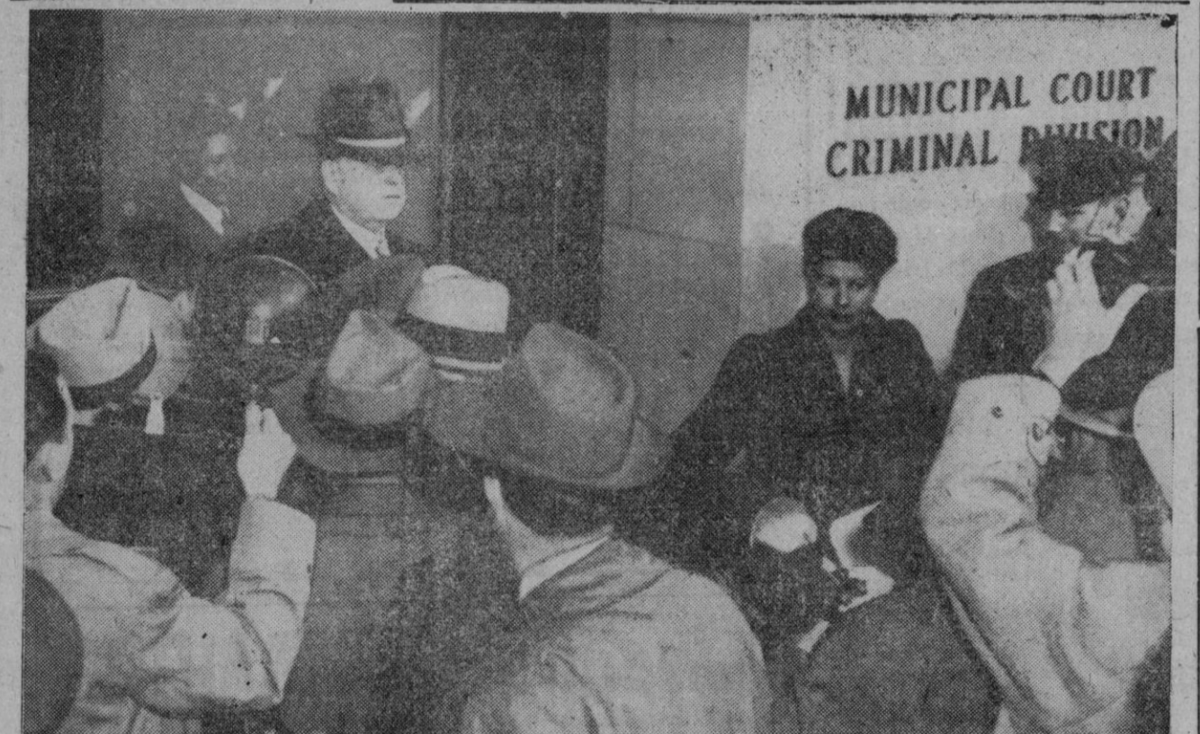
John Lewis, al salir del Tribunal Supremo, después de prestar declaración en el juicio que se le sigue con motivo de la huelga minera, se ve rodeado por periodistas y fotógrafos

Washington, 15 (1 t.).—Ante el Tribunal Supremo han declarado durante cuatro horas los testigos en el juicio contra John Lewis. Se indica que pasarán por lo menos tres semanas antes de que el Alto Tribunal dé a conocer su veredicto sobre las apelaciones interpuestas por Lewis y el Sindicato de mineros contra las multas que les fueron impuestas por desobedecer el mandamiento judicial dictado por el Tribunal federal en Noviembre último.—Efe.