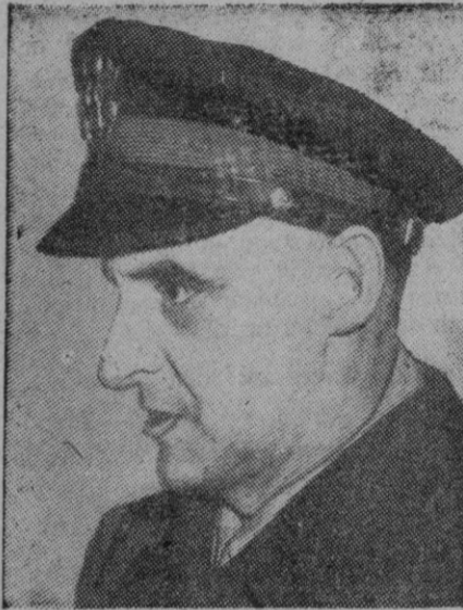
El general Lucius D. Clay, nuevo jefe de las fuerzas americanas en Alemania