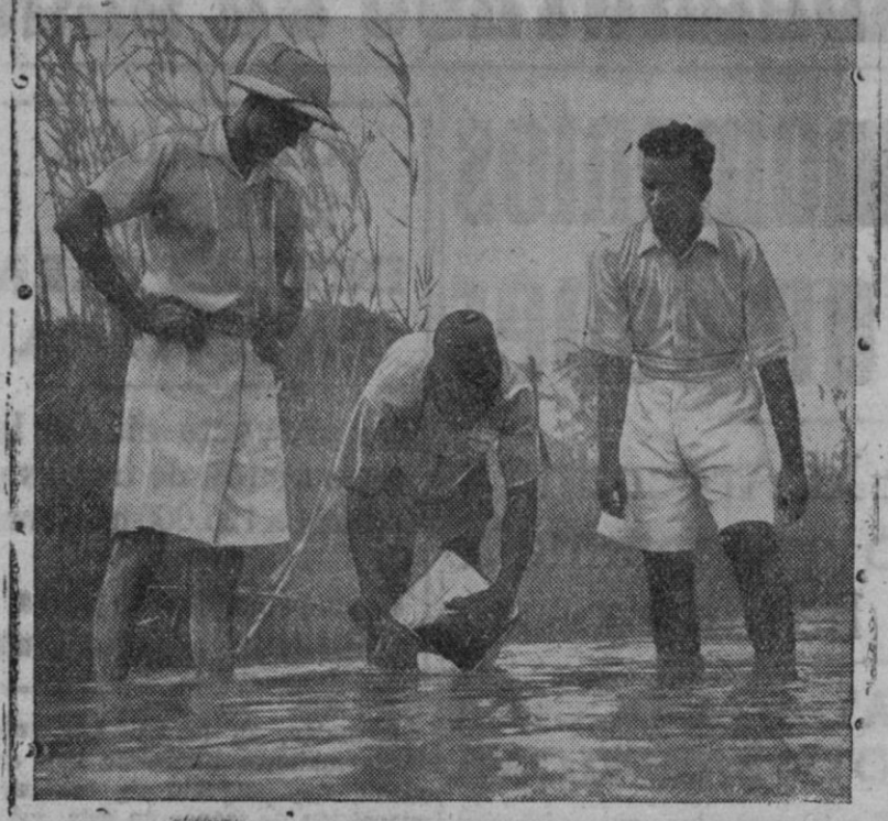
Los peces que se alimentan de los mosquitos portadores del paludismo, son criados especialmente en aguas estancadas. Dichos peces son oriundos del Panamá, donde jugaron un papel importantísimo en la reducción del paludismo durante la construcción del famoso canal