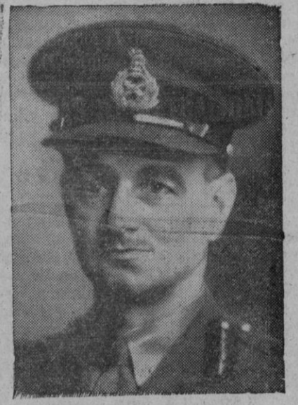
El teniente general F. E. W. Simpson, jefe del Estado Mayor imperial británico