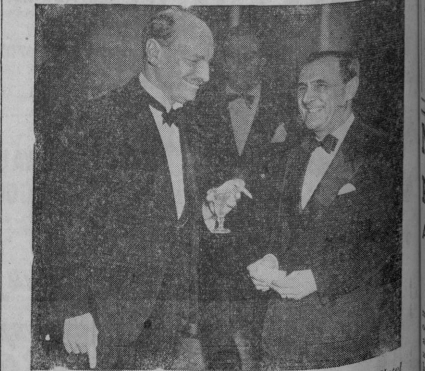
El primer ministro británico dió una recepción en el Hotel Claridge, de Londres, al ministro de Asuntos Exteriores del Brasil, que visitó Inglaterra para tratar de un nuevo convenio comercial entre los dos países. En la fotografía aparecen minister Attlee y el señor Da Fontoura durante la recepción