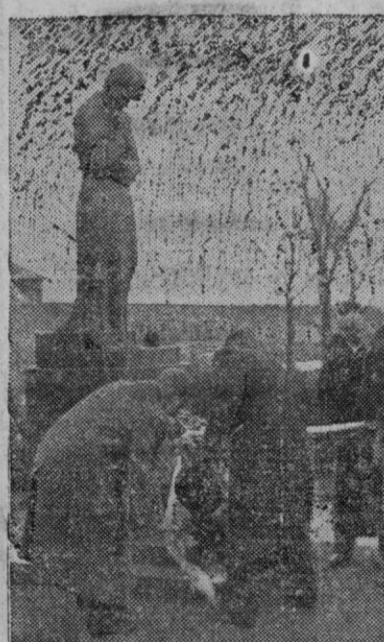
La foto recoge el momento en que, hace años, una delegación de congresistas de la Semana Internacional de la Lucha contra el Cáncer depositaba una corona a los pies del monumento erigido en Polonia a su ilustre hija Marie Curie Sklodowska, descubridora, con su esposo Pedro, del radio

diera parecerse, de cerca o de lejos, a la publicidad y porque además, temía que, con la mejor intención del mundo, deformasen su manera de pensar y la traicionaran.