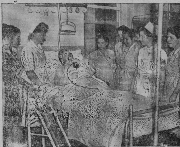
Un grupo de enfermeras griegas visitaron recientemente en Londres un hospital británico, en donde asistieron a unos cursos en Inglaterra. En esta fotografía, las enfermeras observan cómo le es administrado a un paciente un tratamiento de oxígeno