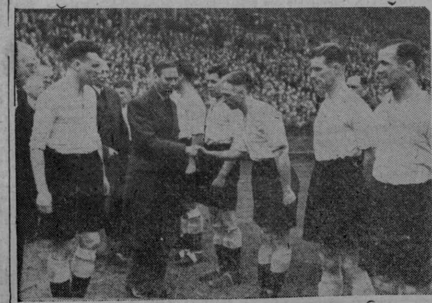
Antes de comenzar el partido final de la Copa de Inglaterra, el Rey Jorge saluda en el Stadium Wembley, a los componentes del Derby County, ganador de la Copa. Este equipo derrotó, después de una emocionante prolongación del encuentro, al Charlton Athletic por cuatro a uno