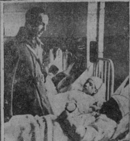
Humberto II de Italia en una de sus visitas a los heridos durante la guerra

Roma, 10.—En el Consejo de ministros celebrado el viernes, el presidente, De Gasperi, dió lectura a una carta recibida del Príncipe Humberto II, redactada en los siguientes términos: «La abdicación de mi padre, el Rey Víctor Manuel III, me concede la sucesión en el trono. La abdicación altera los poderes que he tenido como lugarteniente del reino. Tampoco modifica en ningún sentido la promesa hecha por mí respecto al referéndum y a la Constitución. Estoy convencido de que el Gobierno desea colaborar conmigo en interés del país hasta que se hagan patentes las decisiones de la consulta popular».—Efe.