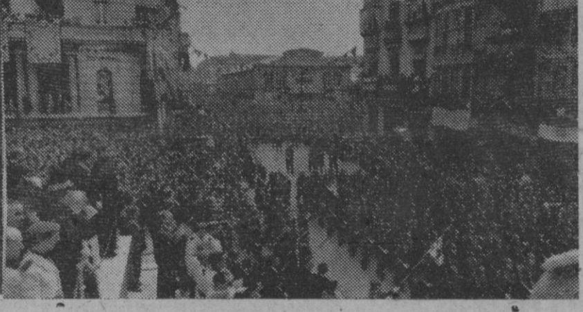
Desfile de la guarnición de Vitoria ante S. E. el Jefe del Estado, durante la celebración de los actos del centenario de Fr. Francisco de Vitoria