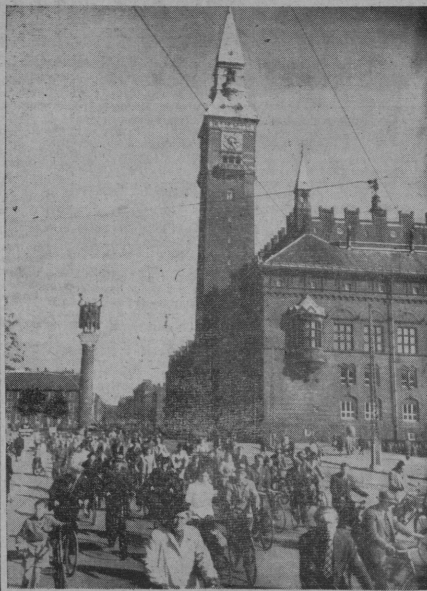
Dinamarca es, quizá, el país donde hay mayor número de bicicletas. La foto nos ofrece una estampa de Copenhague a la hora de comenzar el trabajo. Obreros y empleados pasando, en sus bicicletas, por delante de la Casa Consistorial, camino de sus oficinas o de sus talleres