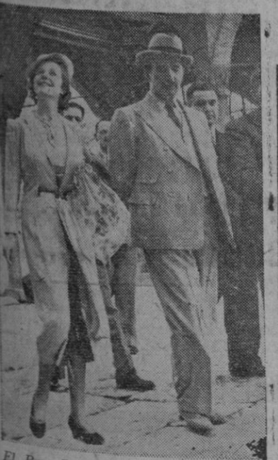
El Rey Zogu y su esposa, Geraldine

Londres, 7 (n.).—El periódico «Daily Mirror», escribe: «El Rey Zogu, de Albania, ha estado esperando durante meses y meses, en su casa de campo de Inglaterra, una llamada telefónica que ahora ya no llegará nunca. La llamada que esperaba, era un requerimiento para regresar a su patria liberada, pero el Gobierno provisional de Albania, de acuerdo con el británico y con el norteamericano, ha decidido no hacerle semejante requerimiento, por lo que Zogu ha venido a sumarse, de este modo, al grupo, cada vez mayor, de Reyes sin Trono. La sola mención del Rey Zogu, por parte de los representantes aliados en Albania, provocó el enfurecimiento del Gobierno provisional de Albania. Desde la liberación de Albania, no ha llevado a cabo ninguna campaña activa para volver al Trono. Era un optimista y se ha limitado a esperar.»