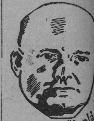
Arciszewski, jefe del Gobierno polaco de Londres