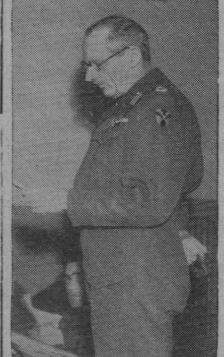
Montgomery, jefe de las fuerzas aliadas que atacan entre el Mosa y el Rhin

maciones norteamericanas en el sector comprendido entre Aquisgrán y Colonia, ha alcanzado su punto culminante, según declaró esta tarde a los periodistas el portavoz militar de la Wilhelmstrasse. El alto mando an-