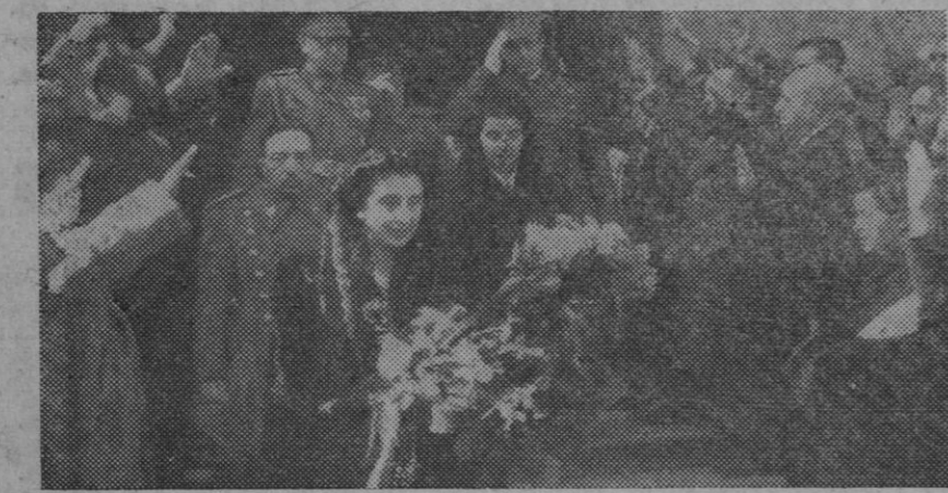
La esposa y la hija del Caudillo, acompañadas del ministro de la Gobernación y de otras autoridades, saliendo de la Iglesia de San Francisco el Grande, después de asistir a la misa celebrada con motivo de la festividad del Santo Angel de la Guarda, Patrón del Cuerpo general de Policía y Policía Armada