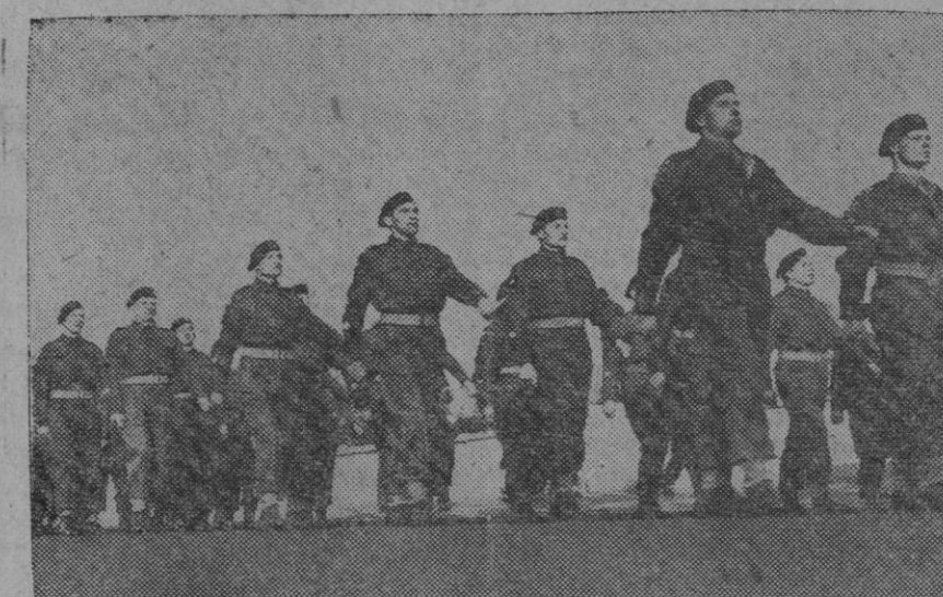
Paracaidistas británicos que tomaron parte en los combates de Arnhem, en Holanda, desfilan por las calles de Londres durante la ceremonia en la que fueron visitados por el Rey

Entre el Rhin y el Mosa, las fuerzas aliadas prosiguen su avance contra creciente resistencia enemiga. Continúan los duros combates en las afueras de Moyland y al Norte de Goch, donde nuestras tropas han limpiado el bosque de Cléveris y han avanzado hasta un punto situado a kilómetro y medio de la ciudad. Sigue la batalla en la región de Afferden. Las fuerzas aliadas han contenido un contraataque enemigo de poca importancia en la zona de Udenbreth. Al Suroeste de Prum, nuestros elementos han llegado a las alturas que dominan el río Prum, a unos seis kilómetros y medio de la ciudad del mismo nombre. Al Sureste de Grosskampenberg, nuestras fuerzas han limpiado de enemigo Kesfeld, y en la zona situada al Suroeste de dicha ciudad, hemos ganado unos mil metros de terreno. Otros elementos aliados han cruzado el río Our y han avanzado dos kilómetros y medio aproximadamente, hasta una altura situada a cerca de cinco kilómetros al Norte de Vian den. Al Noroeste de Echernach,