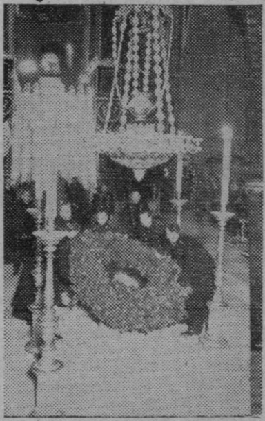
El Caudillo, con la Vieja Guardia, en el solemne momento de colocar la colosal corona de laurel sobre la tumba de José Antonio