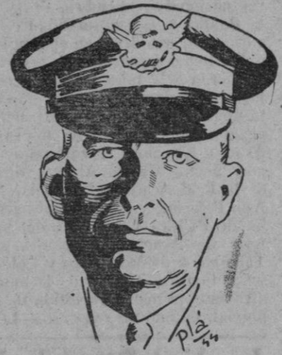
El general Path, jefe del séptimo Ejército norteamericano que opera entre las fuerzas de Patton y el primer Ejército francés, sobre Nancy y S. Die, y cuyo objetivo, al parecer, es Estrasburgo