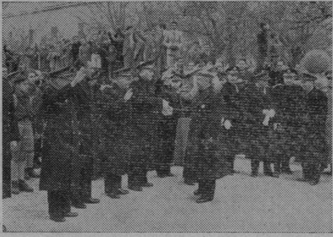
En la lonja escorialense el Caudillo saluda a los miembros del Gobierno que asistió en pleno, con otras jerarquías nacionales, a los funerales por el alma de José Antonio.

El Caudillo y el Gobierno en pleno, en El Escorial