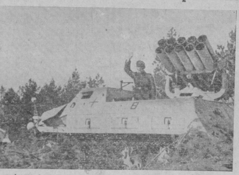
Lanzacohetes alemán montado sobre un coche blindado, que dispara a considerable distancia

Será una cuestión de honor para el país el hacer un esfuerzo para ayudar a los países devastados por la conflagración armada.—Efe.