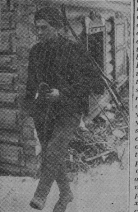
Los soldados soviéticos que caen prisioneros de los finlandeses, se admiran del humanitario trato que reciben. He aquí a uno de ellos capturado en el istmo de Carelia