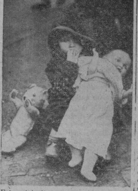
Esta criaturita, cuyo semblante refleja todavía el espanto que le han causado los bombardeos, espera, rodeada de sus juguetes preferidos, el momento de ser colocada en el tren para buscar un refugio de paz en un escondido lugar de la campiña