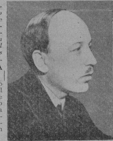
El Presidente de Finlandia, Risto Rytí

Wáshington, 16.—El Presidente Roosevelt ha recomendado hoy a Finlandia que salga urgentemente de la guerra. En su declaración el Presidente norteamericano declara que siempre le ha extrañado al pueblo de los Estados Unidos la alianza de Finlandia con la Alemania nacionalsocialista, y dice que ahora debe aprovechar el pueblo finlandés la ocasión de apartarse de ella. Predice que cuanto más