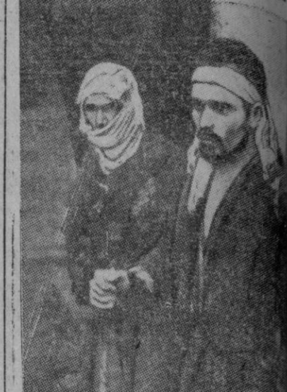
Dos guerrilleros del ejército del general Tito hechos prisioneros.