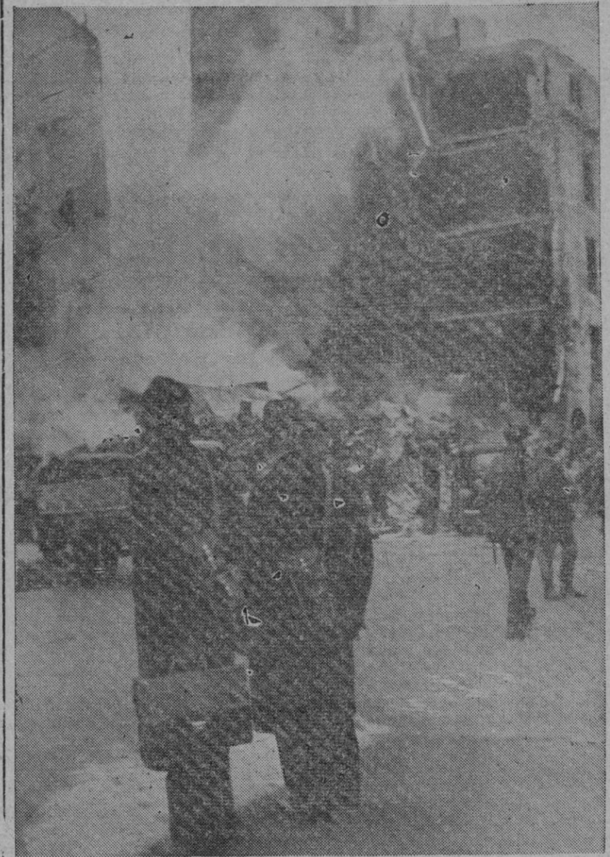
Aspecto parcial de una calle de Helsinki después del primer ataque aéreo bolchevique

Duró doce horas y se registraron numerosos incendios