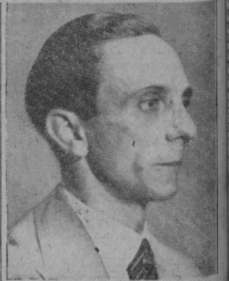
El doctor Goebbels

Analiza seguidamente otros aspectos de la cuestión: el de los recursos que los aliados pondrán en acción para esta empresa y el de las fuerzas que Alemania opondrá a la misma. Afirma que «el enemigo tendrá que utilizar sus reservas y correr un riesgo de vida o muerte. El adversario no sabe los recursos con que nosotros contamos, aunque conozca parte de ellos, que no pueden permanecer en secreto. Conocerá nuestra fuerza en el caso de una invasión, con pérdidas que sobrepasarán los cálculos que haya hecho».—Efe.