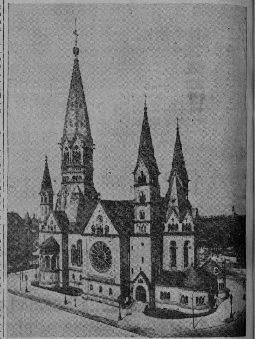
La célebre Gedächtniskirche (iglesia conmemorativa), que ha sido completamente destruida por los ataques británicos

Berlín, 10.—«Mientras dure esta guerra y hasta que la ganemos—escribió en «Das Reich» el ministro de Pro-