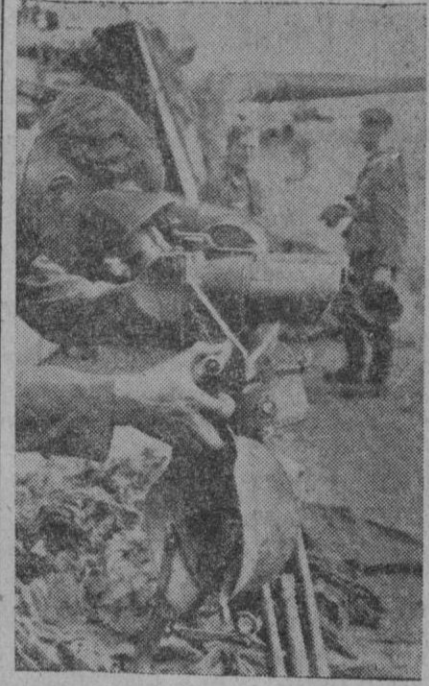
Aprovechando un descanso en la actividad combativa, el jefe de una batería alemana inspecciona detenidamente las posiciones enemigas.

Berlin, 30 (6 t.).—En los medios bien informados de la capital del Reich se declara hoy que los rumores según los cuales von Papen, embajador alemán en Angola, se encuentra en misión especial en la ciudad del Vaticano, carecen en absoluto de fundamento. Se pone de relieve que, desde hace varios años, von Papen no ha ido a Roma. Las tentativas de relacionar su personalidad con las pretendidas maniobras para entablar negociaciones de paz son tan absurdas como las demás versiones sobre proposiciones militares de Alemania.—Efe.