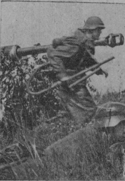
En el curso de un contraataque alemán en el frente del Este, la infantería avanza junto a los famosos tanques "Tigre".