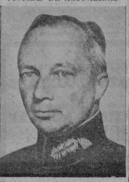
El feld-marschal Günther v. Kluge, uno de los jefes del Ejército alemán del sector central del frente de Rusia, que resultó herido durante una visita de inspección. Sus heridas no son graves, y le permiten permanecer desempeñando su misión en el teatro de la lucha.

Aj Noroeste de esta región, las bandadas han sufrido nuevas pérdidas en el sector de Split, especialmente después de la conquista de nuevos puertos e islas y como consecuencia de las operaciones de limpieza en el interior del país. Una banda que se retiraba hacia el Este, amparada por la noche, ha sido aniquilada. Los pocos supervivientes fueron hechos prisioneros.