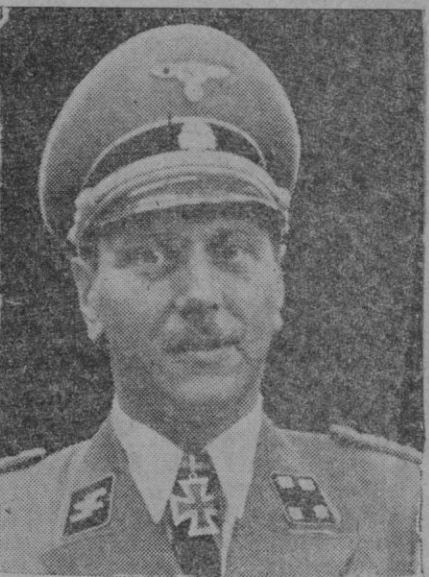
Shorzény, el liberador del Duce, a quien, por su valentía, ha condecorado el Führer con la Cruz de Caballero de la Cruz de Hierro