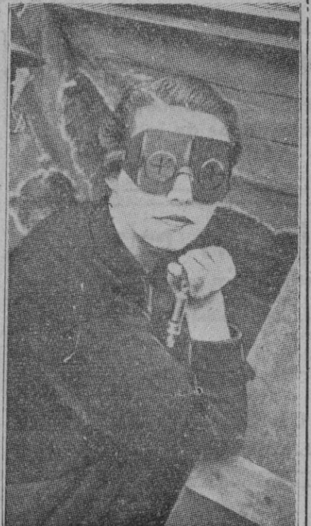
En la entrada de los refugios anti-aéreos ingleses hay unas guardias destinadas a mantener el orden y marcar el final de las alarmas. Sus ojos están protegidos del violento resplandor de las bombas incendiarias, por estas gafas especiales