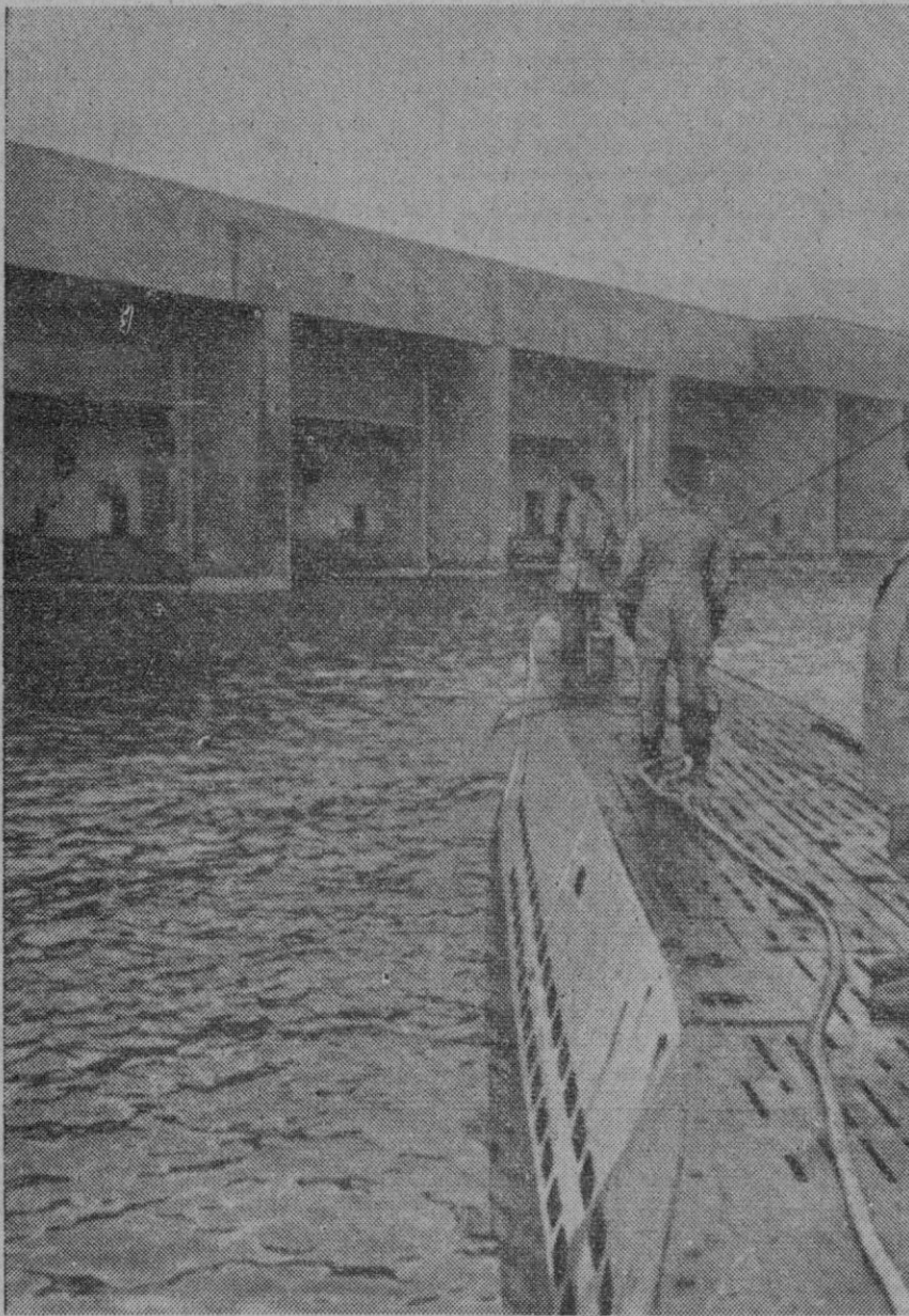
Un submarino del Eje retorna a una de las bases situadas en la costa atlántica