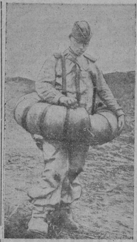
Los rusos han utilizado en sus últimos ataques, trajes de caucho, provistos de cinturones de la misma materia, llenos de aire, para poder pasar a través de los pantanos y rios. Un soldado alemán ensaya el equipo de un enemigo capturado.

Berlin, 2 (5 t.).—Las fuerzas de protección alemanas libraron un encuentro con una formación de lan-