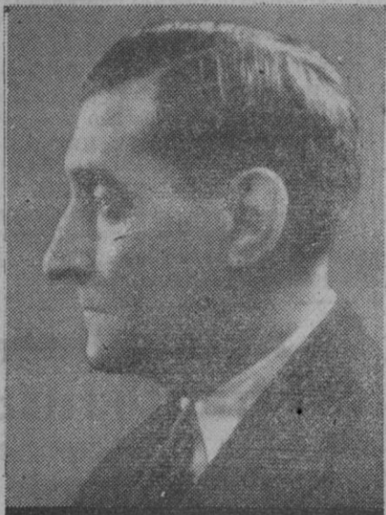
El jefe del Gobierno portugués, Oliveira Salazar

El comunismo es el mayor problema humano de todos los tiempos