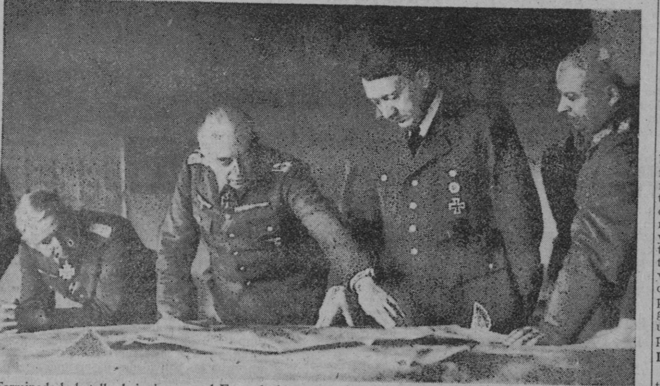
Terminada la batalla de invierno en el Este, el alto mando alemán procede a la gran concentración de elementos que serán empleados en los combates que se iniciará tan pronto lo permita el estado del terreno. Recientemente el Führer visitó las líneas avanzadas del frente ruso donde se entrevistó con los altos jefes de las fuerzas del Reich. La presente fotografía corresponde a una de esas entrevistas, y vemos de izquierda a derecha al mariscal general von Manstein, al coronel general Ruoff, al Canciller Hitler, al general Zeitler y al mariscal general von Kleist