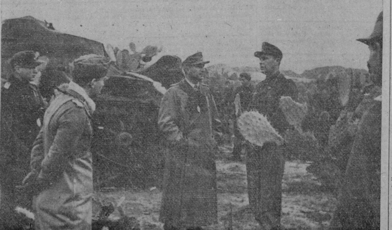
Una división acorazada alemana disimulada entre los captus gigantes, en la zona oriental de Túnez. Los jefes de la unidad cambian impresiones antes de efectuar una operación.