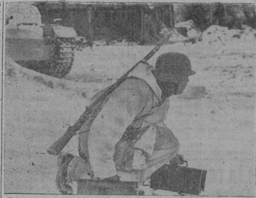
Este soldado alemán, escondiéndose al fuego enemigo, lleva municiones a sus camaradas de una posición avanzada que resiste tenazmente las embestidas soviéticas.

Berlín, 10 (2 t.).—En un resumen sobre la situación en el frente del Este, la Oficina Internacional de Información declara: En tanto que en el sector de San Petersburgo las baterías alemanas de largo alcance han bombardeado con señalado éxito varias empresas industriales, y mientras en otros puntos la actividad ha disminuido notablemente, quedando reducida a acciones de reconocimiento por ambas partes, en el sector inmediato del Sur, cerca de Staraya Rusa y del curso del Lowat, nuevo teatro de operaciones, se han registrado ataques en masa de los bolcheviques. Al extender sus ataques hasta el lago Ilmen, los bolcheviques han intentado en vano compensar el hecho de que las divisiones alemanas hayan alcanzado todas las posiciones fortificadas del río Lowat, en las que se han instalado sólidamente. Los esfuerzos soviéticos para ganar terreno con ataques sobre el flanco septentrional, han fracasado en un amplio frente, y las piezas de largo alcance y de calibre medio han aniquilado nuevamente las masas de asalto bolcheviques y sus posiciones de partida. Ante las posiciones alemanas profundamente escalonadas, y a consecuencia de las elevadas pérdidas de sus tropas de choque, los bolcheviques han comprobado también el lunes que los objetivos no conquistados cerca de Demiensk, a consecuencia de la lentitud de su observación, no pueden ser compensados en el Lowat ni siquiera a costa del máximo sacrificio de hombres y material.