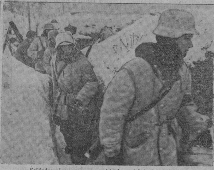
Soldados alemanes en una trinchera del frente del Este

23 (2 t.)—Las fuerzas aéreas alemanas han tenido una gloriosa jornada en el frente oriental, anunció la Oficina Internacional de Información. Millares de aviones de bombardeo de cazas y de aparatos de caza de los tipos—dice la información—actúan incansablemente día y noche en el frente ruso. La protección de las bases funcionó con tal precisión que los aviones de bombardeo no sufrieron pérdidas. Treinta y un aviones bolcheviques fueron derribados en combates aéreos y otros dos por la acción de la D. C. A. Alemana. Unicamente tres cazas alemanos han regresado a sus bases.