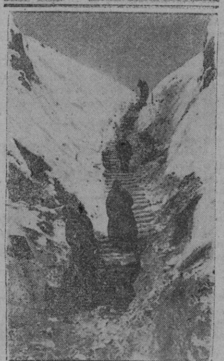
Prisioneros soviéticos ocupados en posición en estado transitable para las tropas alemanas, este desfile tan abrupto

de copar la carretera de retirada de esta división, pero después de una encarnizada batalla que duró varias horas, y con la pérdida de más de cuarenta cañones por parte del enemigo y que capturaron nuestros soldados, el adversario fué derrotado y la «Tridentina» continuó su marcha hasta reunirse con las fuerzas alemanas. El general Julio Martinat halló muerte gloriosa en el campo de batalla durante esta memorable jornada. El heroísmo ha prendido en el corazón de todos los italianos que luchan desde el Sur del lago Ladoga hasta el Cáucaso, por el porvenir de Europa.—Efe.