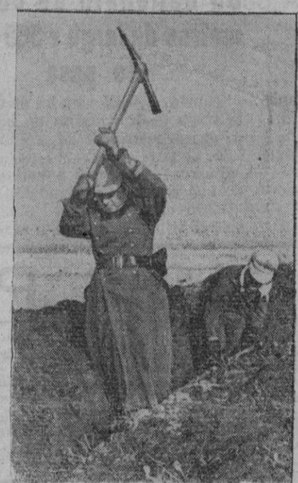
Detrás de la primera línea de combate son construidas posiciones, cavando estos soldados alemanes emérgicamente en el suelo que se halla helado.