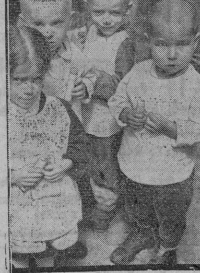
Niños rusos pertenecientes a un asilo establecido en la parte del país ocupada por las tropas alemanas. En los semblantes, muy serios de los pequeños, puede verse marcada la huella de las penalidades sufridas