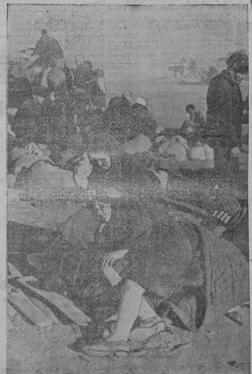
La foto recoge el momento en que algunos habitantes de Stalingrado, con sus ajuares, esperan, fuera de la ciudad, ser enviados a una zona menos peligrosa.