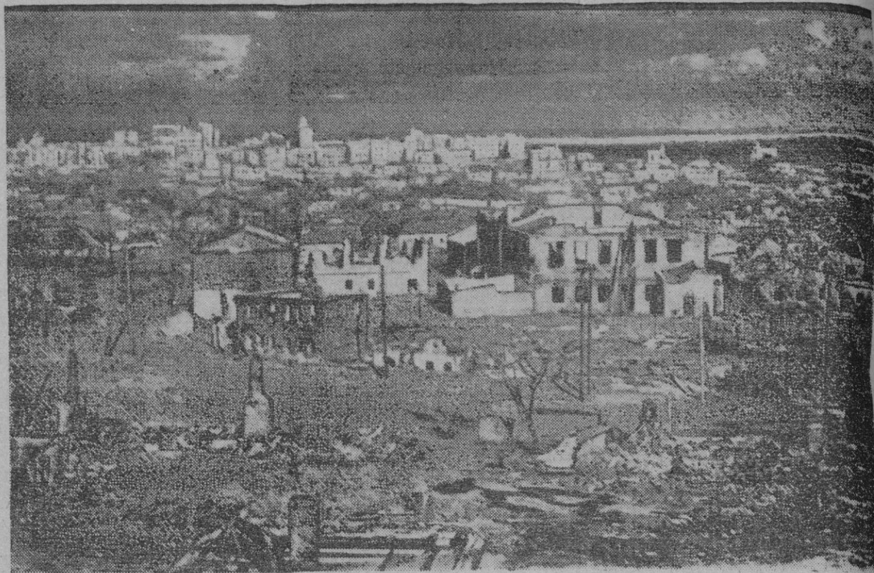
He aquí la ciudad de Voronej, en la Rusia soviética, después de los combates librados en sus calles