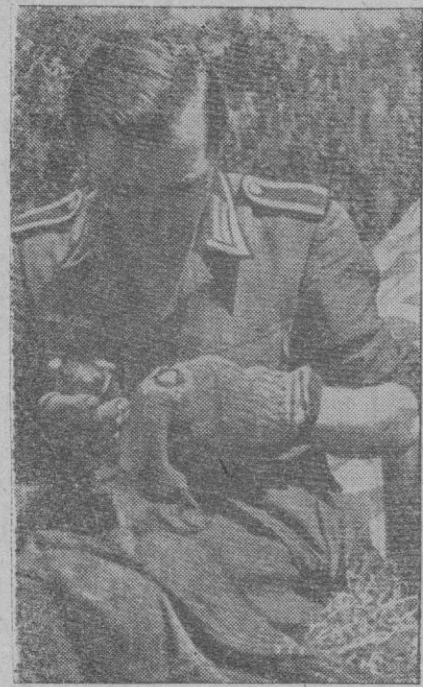
Este soldado alemán, que vemos tan atareado en la fotografía, está cosiendo sus calcetines, y para esto aprovecha, a falta de otra cosa, una granada de mano, ovalada.

El FRENTE DE JUVENTUDES combate esta lesolación, movilizándolo a la juventud para la repoblación forestal de los eriales castellanos.