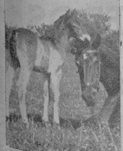
El potro juguetea incansable por el campo, pero cuando el fotógrafo quiere tirar una placa que recoja sus divertidos saltos, tiene miedo y busca la protección de su madre