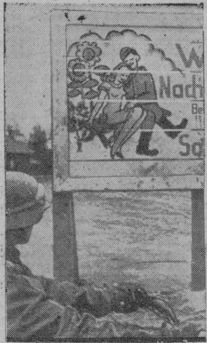
Este cartel está colocado cerca de una carretera importante de transporte en el frente oriental, e invita a los conductores a circular con mucho cuidado. El motorista de enlace parece preocupado con el cartello en cuestión

Lisboa, 18.—Nicolás Franco, embajador de España en Portugal, conferenció ayer con el presidente Salazar.—Efe.