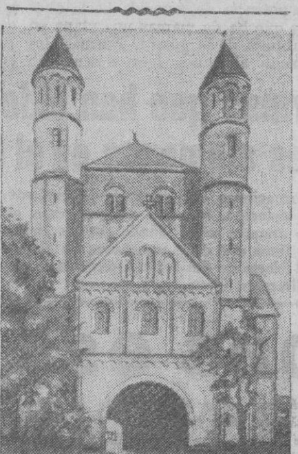
EL BOMBARDEO DE COLONIA.—Entre los edificios destruidos por los bombardeos aéreos ingleses, figura la iglesia de San Pantaleón, que vemos en el grabado.

Tokio, 13 (5 t.).—Gran cantidad de armamento, municiones y material de guerra destinado al Gobierno de Chung King ha sido capturado por las tropas japonesas que avanzan a lo largo de la carretera de Birmania hacia el interior de China. Entre el botín recogido últimamente figuran quince tanques, seis auto-ametralladoras y 1.200 vehículos automóviles. Efe.