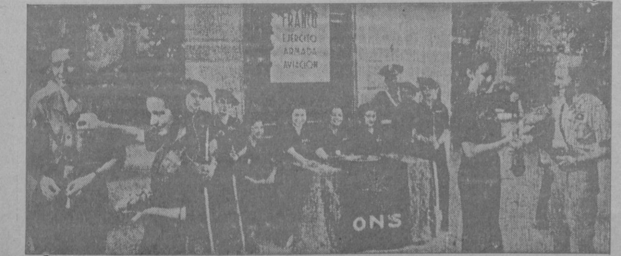
Para el Ejército, la Armada y la Aviación