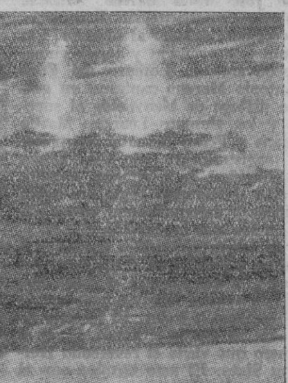
FOTO TRANSMITIDA POR RADIO.—Nos muestra a la escuadra americana anclada en Pearl Harbour, durante el ataque de que fué objeto al comienzo de las hostilidades por los aviones japoneses

Continúan con violencia los combates neerlandés anuncia. Prosigue con violencia el combate en Amboina y el curso de la batalla se inclina alternativamente en favor de una parte y de otra. Los bombarderos de varias ciudades y aeródromos de Java, realizados ayer, martes, fue-