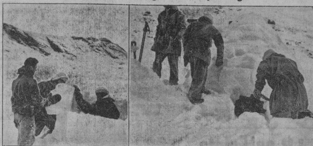
En las regiones árticas del frente Oriental los soldados alemanes se asimilan las costumbres esquimales. Como vemos en esta foto, aquéllos construyen su refugio con bloques de hielo

En África del Norte, las fuerzas indias que protegían la retirada británica han sido batidas y rechazadas. Nuestros bombarderos castigaron a las columnas de camiones en la región de Tobruk y atacaron los depósitos de material situado en las proximidades de Marsa Matruh. Han prosiguído los ataques contra las bases aéreas, posiciones de la D. C. A. y otras instalaciones militares de las islas de Malta y Gozzo.—Efe.