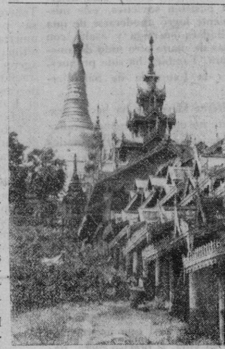
La jamaica Pagoda de Oro de Shao Dagon, en la capital de Birmania, Rangun, que ha sufrido importantes ataques de la aviación japonesa.

Cuarto. Son absurdas e indignas las informaciones que presentan a la