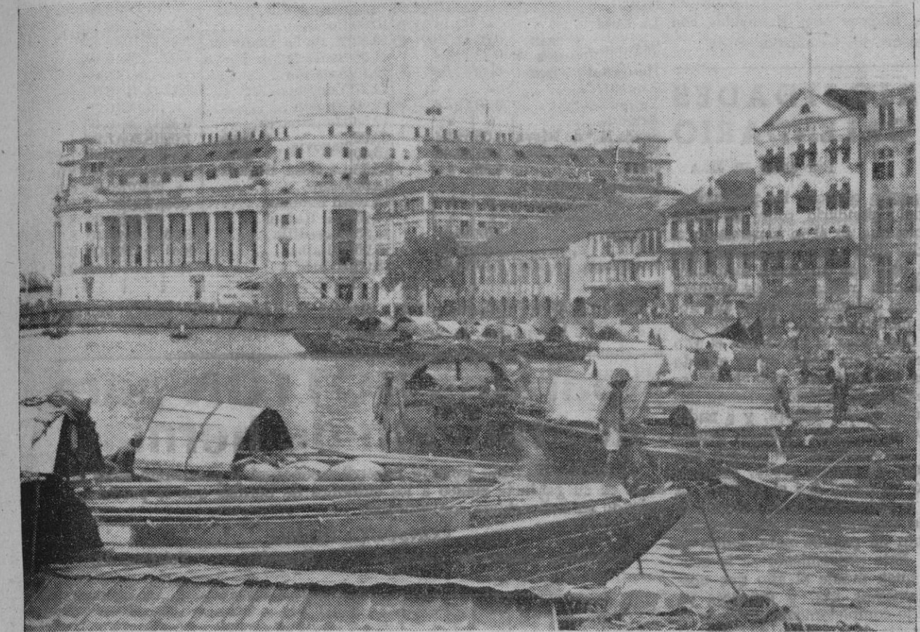
Las fuerzas japonesas que avanzaban por la península de Malasia, hacia Singapur, han alcanzado la costa meridional de aquel territorio, por lo cual se hallan separadas de la citada base naval solamente por un canal. La fotografía nos ofrece una vista del puerto de Singapur.

En su avance, los japoneses rinden homenaje a San Francisco Javier Si las discusiones se convierten en un desafío al Gobierno