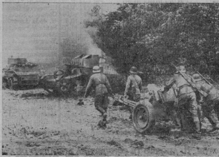
LA OFENSIVA EN EL FRENTE CENTRAL.—Rechazado el ataque de los tanques rojos, dos de los cuales han sido incendiados, este antitanque alemán ocupa la nueva posición.

Comunicado alemán Gran Cuartel General del Führer, 15 (5 t.)—Comunicado del Alto Mando de las fuerzas armadas alemanas: Las tropas germano-rumanas han ganado terreno en dirección a Sebastopol y Kersch, a pesar de la tenaz resistencia del enemigo.