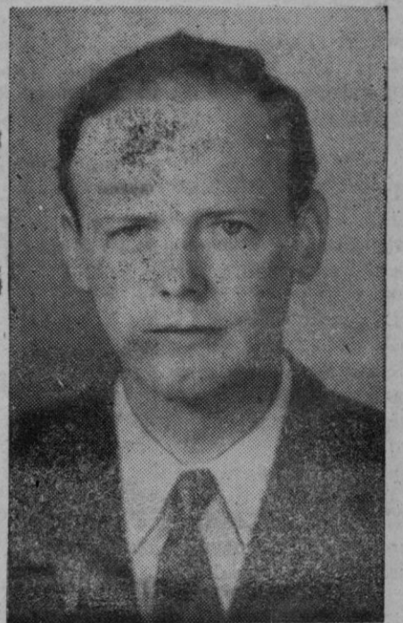
El coronel Lindbergh, una de las más relevantes figuras norteamericanas que participan en la campaña contra la intervención.