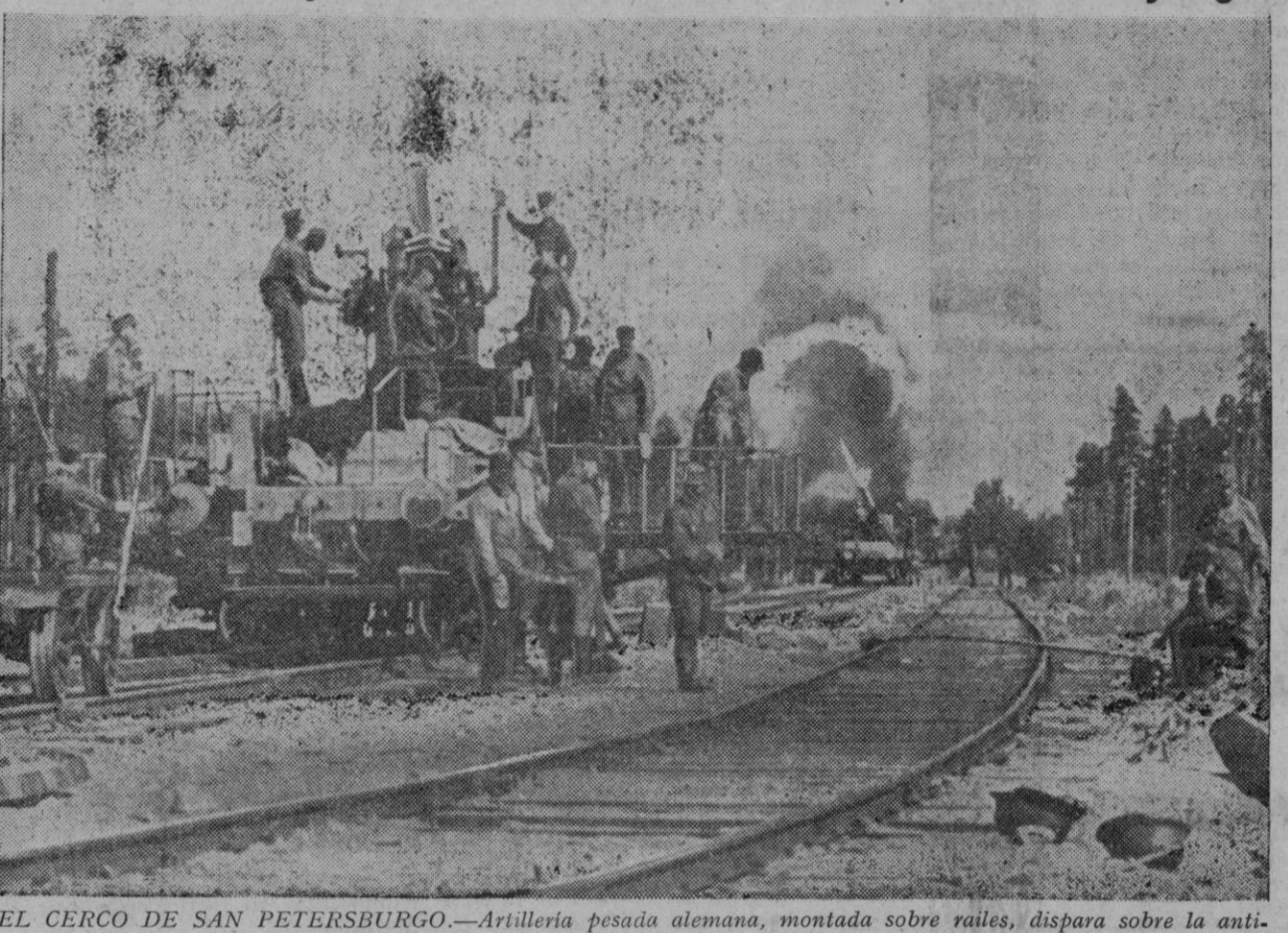
EL CERCO DE SAN PETERSBURGO.—Artillería pesada alemana, montada sobre railes, dispara sobre la antigua capital zarista. En primer plano un puesto de observación establecido sobre la plataforma de un vagón

Roma, 31 (noche).—Radio Moscú ha anunciado que la temperatura ha bajado en la región de la capital soviética a 35 grados bajo cero, admitiendo a la vez que la presión alemana no disminuye en el sector central. Las insistentes manifestaciones de Radio Moscú acerca de la baja temperatura parecen querer justificar la gravedad de la situación soviética.