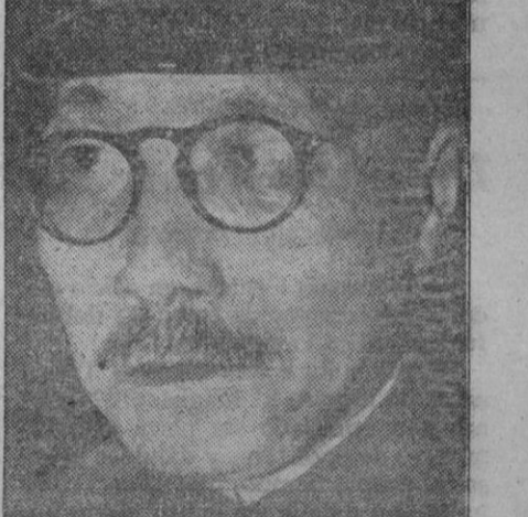
El general Tojo, que ocupa el puesto de primer ministro

El Ferrol del Caudillo, 1.—Ha sido varado en el dique del Arsenal para hacer reparaciones, el crucero «Almirante Cervera».—Logos.