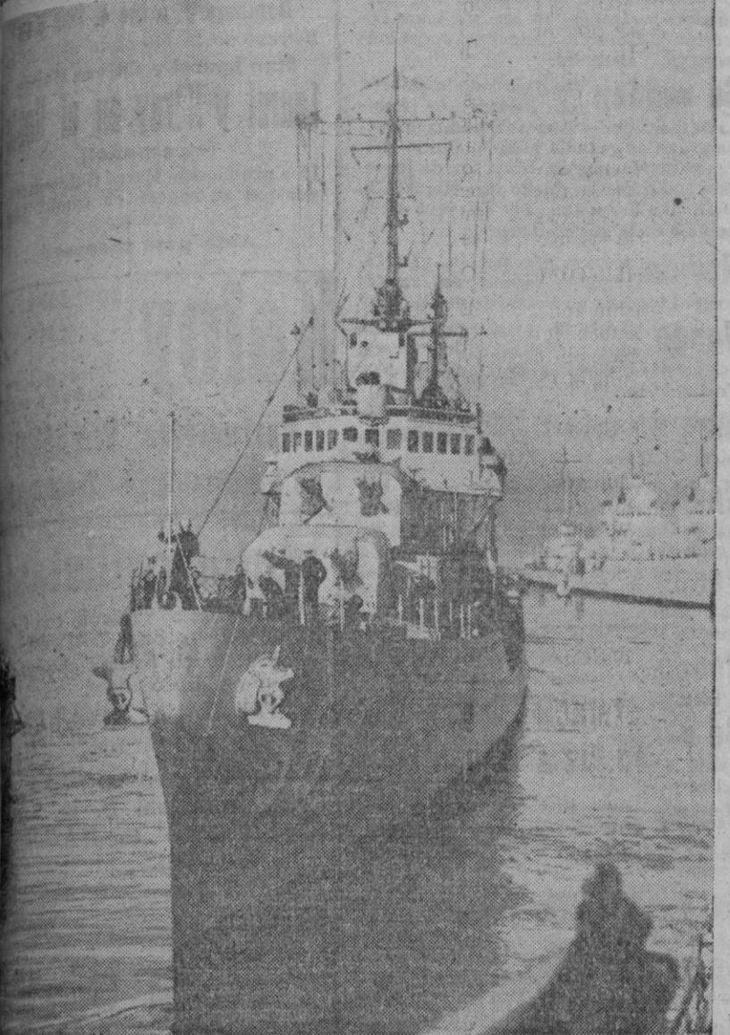
El destructor norteamericano "Kearny", que fué torpedeado recientemente por un submarino alemán en el Atlántico

El senador hace responsable a Roosevelt de las víctimas ocurridas