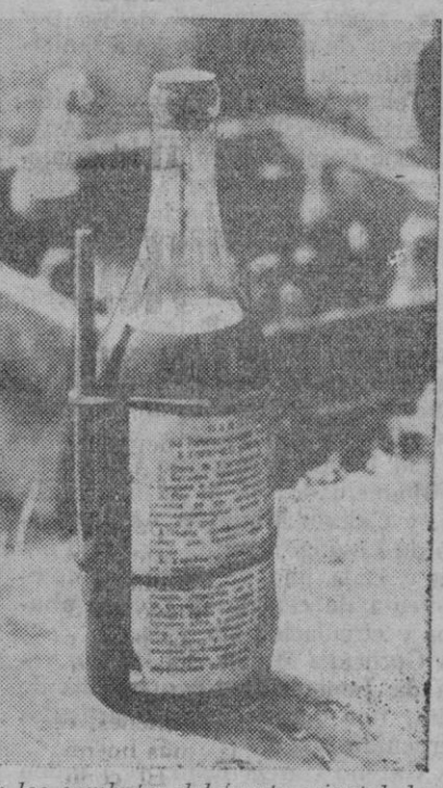
En los combates del frente oriental, los soldados rusos emplean en grandes cantidades una clase de bomba formada por una especie de botella llena de una substancia explosiva y provista de una mecha que el bolchevique enciende al lanzar el artefacto. La fotografía reproduce un de dichas «botellas-bombas» que los soldados finlandeses han bautizado con el nombre de «Cocktail de Molotov».