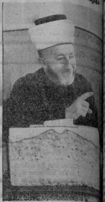
El Gran Mufti de Jerusalén

Milán, 28.—El periódico «Starapa» acoge favorablemente la llegada a Italia del Gran Mufti de Jerusalén y dice que el pueblo italiano se siente honrado por tener como huésped a la más elevada autoridad del mundo árabe y musulmán. El periódico estima que el Gran Mufti es el hombre que más tenazmente ha luchado en su país durante veinte años contra la opresión británica. La prensa en Italia—añade—de la autoritaria propaganda del Intelligence Service que ya ha intentado hacer caer al mundo que la población árabe próximo y el Extremo Oriente de acuerdo con los proyectos de Wawell.—Efe.