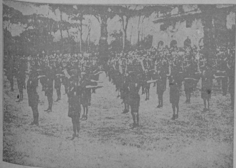
Los Flechas en sus ejercicios