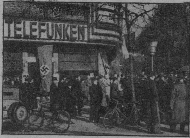
En plena calle, los transeúntes de Berlín pueden escuchar las noticias relacionadas con la guerra