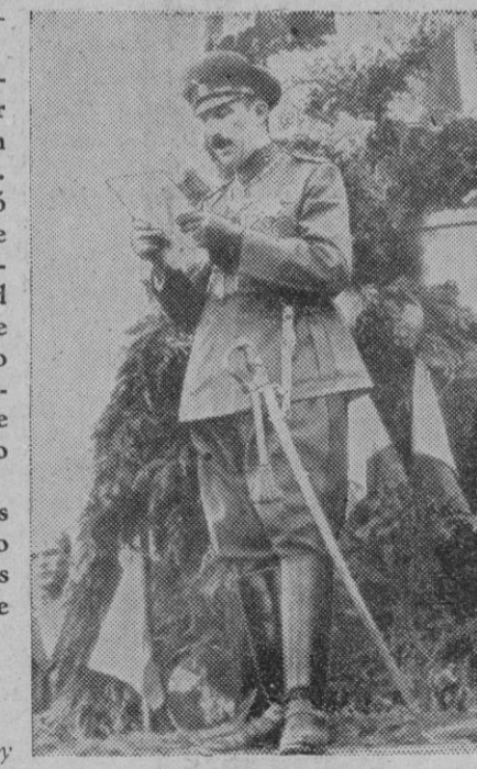
El Rey Boris de Bulgaria tiene predilección por los ferrocarriles. Se le ve aquí, delante de una locomotora adornada con flores y follaje, en el acto inaugural de la nueva vía férrea en las montañas de Bódope

A su regreso el prefecto sostuvo una entrevista con el coronel Sanz Agero, jefe de la zona fronteriza y con otras autoridades españolas para examinar algunos problemas que interesan a la población de la frontera sobre los derechos de pastoreo en las dos vertientes pirenaicas y los de pesca en el río Bidasoa.—Mundial.