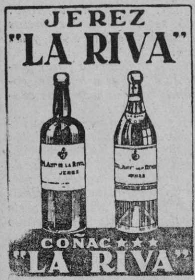
Representante: HERNANSIER Cervantes, 7.—Segovia

Circular número 6. Con el fin de no originar perjuicios a los tenedores de trigo que tengan derecho a mouturar trigo para su consumo familiar... en forma de certificación, bajo la exclusiva responsabilidad de los señores alcaldes respecto de los datos que contengan.