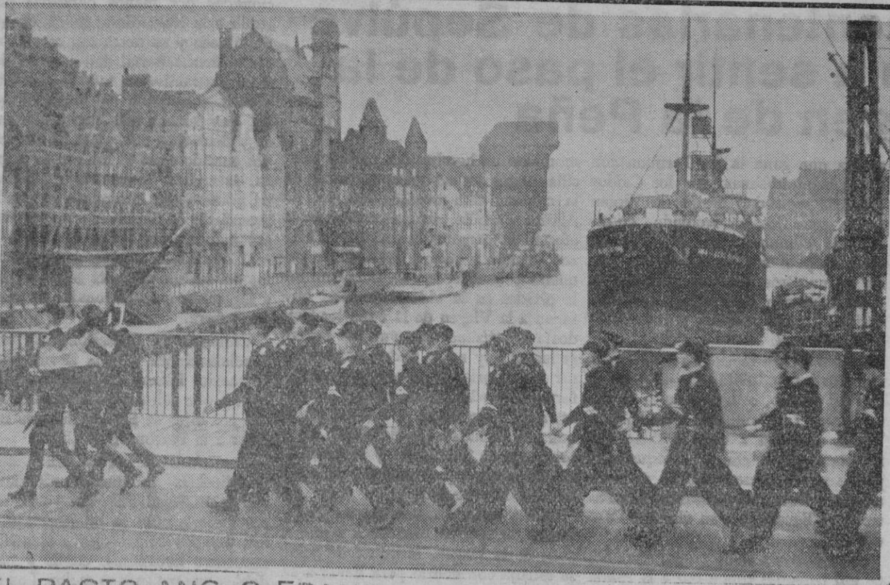
Una formación de jóvenes alemanes de Dantzig pasando sobre el puente de Mottlau en la Ciudad Libre

Veinte heridos, algunos graves Varsovia, 25.—En un pueblo polaco próximo a la frontera germana, han estallado nuevas manifestaciones antialemanas. Es difícil conseguir detalles de lo que motivó los desórdenes, pero se sabe que el jefe local alemán ha sido puesto bajo custodia y que en los desórdenes ocurridos han resultado heridas veinte personas, algunas de gravedad. La Policía polaca ha registrado el domicilio social de los alemanes y algunas casas de destacados elementos germanos.