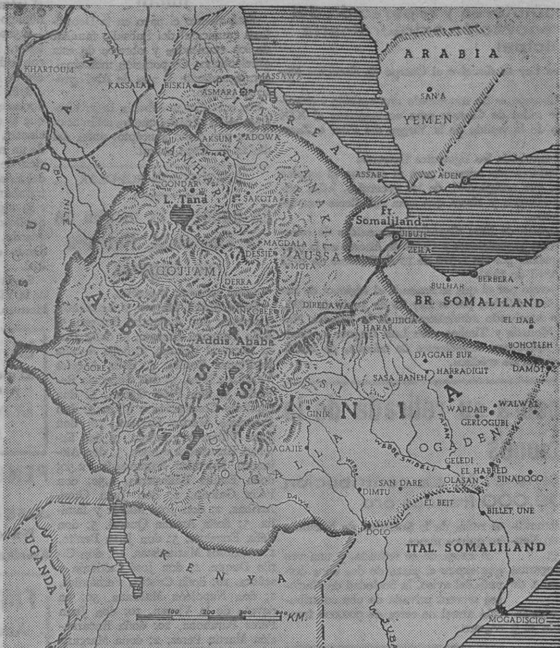
Mapa de Abisinia, el país donde según los agoreros demócratas había de encontrar el fascismo la mas espantosa derrota militar, política, económica y moral. Como ocurrió respecto de España, los enemigos del fascismo inventaban fantásticas victorias etíopes, mientras las bravas tropas italianas progresaban a través del misterioso país con tal regularidad y profundidad que, a los siete meses de iniciarse la campaña, conquistaban un país de mayor extensión territorial que Italia y Alemania y plantaban las bases del poderoso Imperio cuya fundación celebra hoy el pueblo italiano con demostraciones de unidad ciudadana y de potencia militar

Tokio, 9.—A las 9,30 se ha producido una violenta explosión en una casa de productos de celuloide. A la detonación, que ha sido oída en toda la ciudad y sus alrededores, ha seguido un terrible incendio. Hasta este momento no se conoce el número de víctimas, pero se anuncia que es considerable.