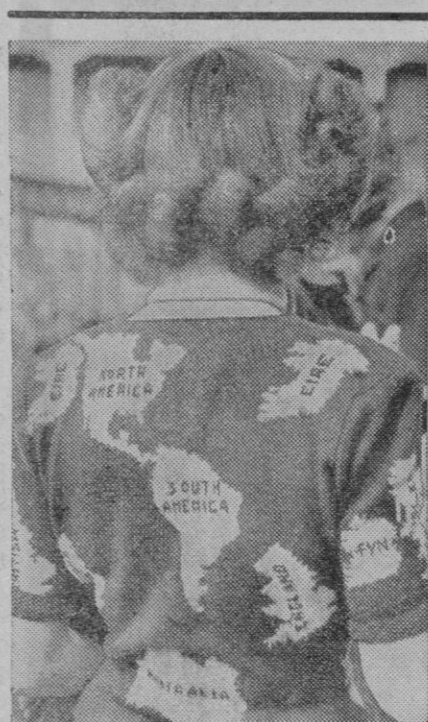
Caprichos de la moda! En la foto aparece una "elegante" luciendo en las carneras de automóviles de Brooklands un modelo de autopompa a la situación política internacional

El secretario general de Falange ha expresado su deseo de que la celda que ocupó José Antonio sea conservada en el estado que se encuentra hoy.