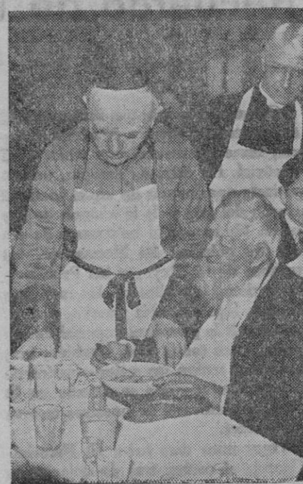
El cardenal Verdier, de París, durante una visita al comedor de los Hermanos de los Pobres, sirve a éstos personalmente la comida