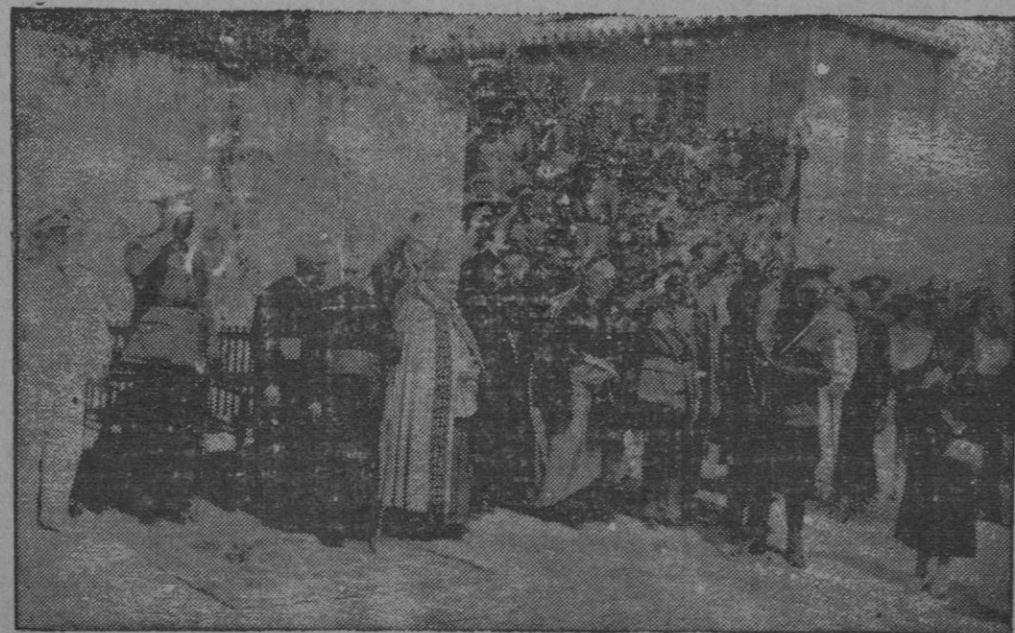
Entrega de la Bandera al Batallón de Infantería de Marina