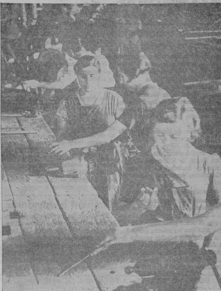
Cuando Negrín publicó la orden de movilización de todos los hombres aptos para servicios de armas, las mujeres tuvieron que reemplazarlos en las fábricas. Vista de una nave donde las mujeres eran instruidas en su nuevo trabajo

CUANDO EN BARCELONA MOVILIZARON A LAS MUJERES